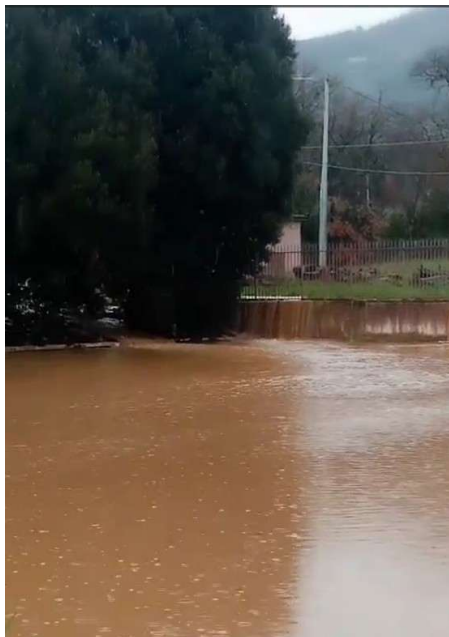
Parcheggio allagato giorno 12/02/2026