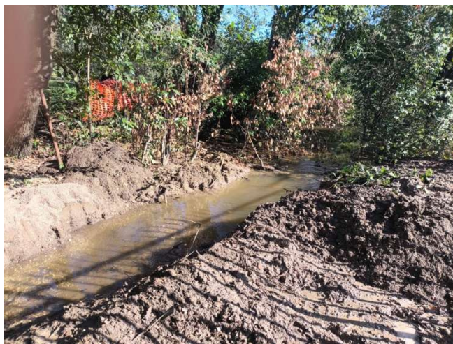
Intervento con mezzo escavatore e risoluzione della problematica il giorno 13/02/2026