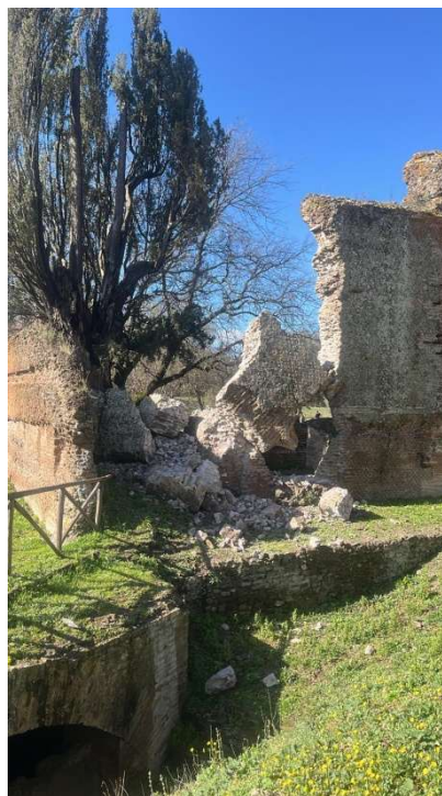
Dopo il crollo