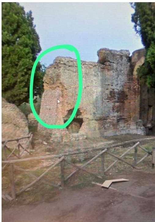
Prima del crollo